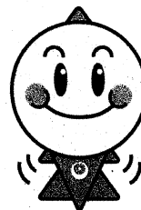
浜田市食育推進 キャラクター 「びびくん」

給付型のため返還不要! 他の奨学金との併給可能! ※浜田市奨学金制度との併給は不可 (申請は可能)