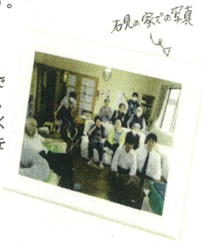
お弁当を配る様子

「きつい仕事というマイナスイメージが強いかもしれませんが、慣れていけば会話もできて楽しい仕事だと思いますので、ぜひ興味を持ってみてください。」