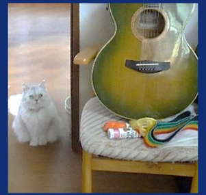
プロフィール 地歴公民科教員 趣味はテニスとギター